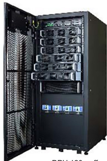
DPH 120 - offen