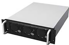
Powermodul: 20 kW

Die DPH 80/120 überzeugt als Nachfolgermodell der NH+ mit neuester Technologie, verbessertem Design und vielen neuen Features. Diese fortschrittliche, modulare USV-Anlage basiert auf umfangreicher Erfahrung in digitaler Leistungselektronik. Der hohe Wirkungsgrad, die effiziente Funktionsweise der USV in Kombination mit dem Green Mode ermöglichen hohe Energieeinsparungen in ihrem Unternehmen. Durch schnellen DSP und neuester Kommunikationstechnologie zeichnet sich das DPH 80/120-System durch Erweiterungsfähigkeit und höchster Verfügbarkeit aus.